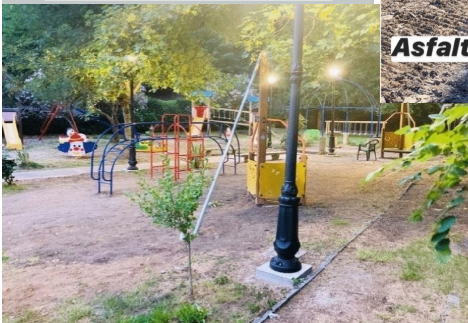
Nuove giostre al "Nido degli Aquilotti"