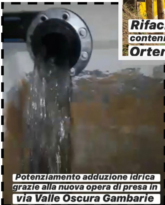
Potenziamento adduzione idrica grazie alla nuova opera di presa in via Valle Oscura Gambarie