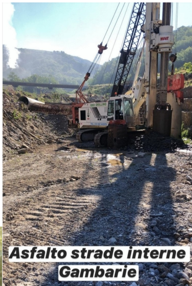
Asfalto strade interne Gambarie