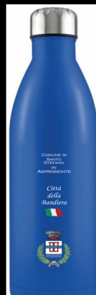
Per i nostri ragazzi ci siamo preparati al nuovo anno scolastico!