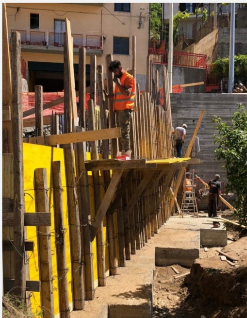
Rifacimento muro di contenimento della via Delle Ortensie in Mannoli