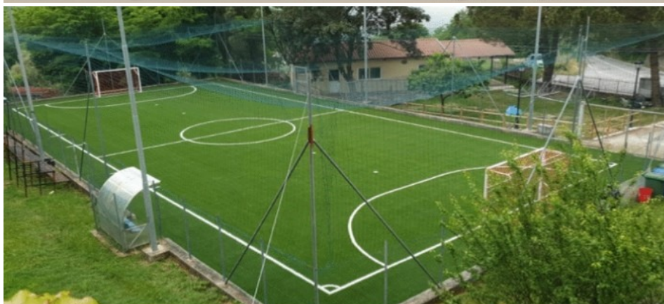
Rifacimento campo in erba sintetica presso la Villetta "Il Nido degli Aquilotti" a Santo Stefano