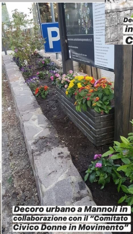
Decoro urbano a Mannoli in collaborazione con il "Comitato Civico Donne in Movimento"