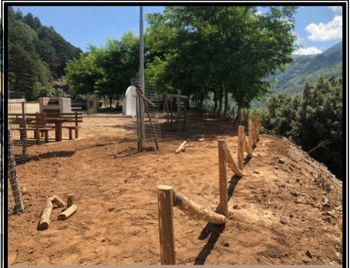
Area naturalistica di Mannoli