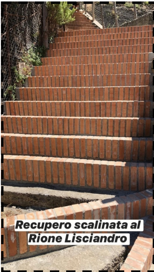
Recupero scalinata al Rione Lisciandro