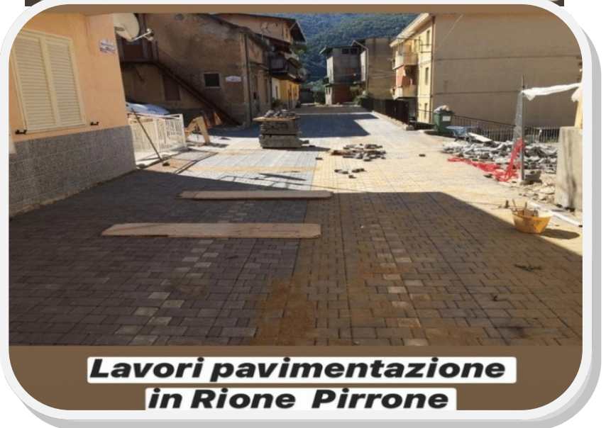
Lavori pavimentazione in Rione Pirrone