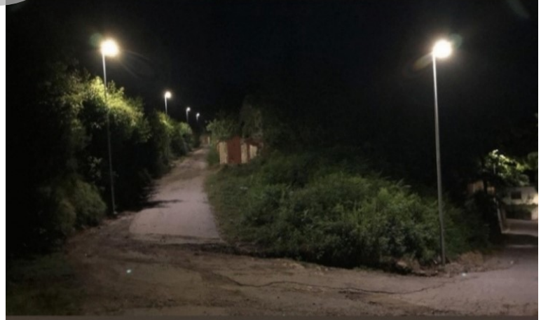
Estensione della rete di pubblica illuminazione in Contrada Ventria