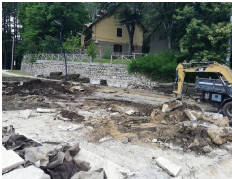
Lavori di Riapertura ai veicoli dell' attraversamento della Piazza Grande a Gambarie