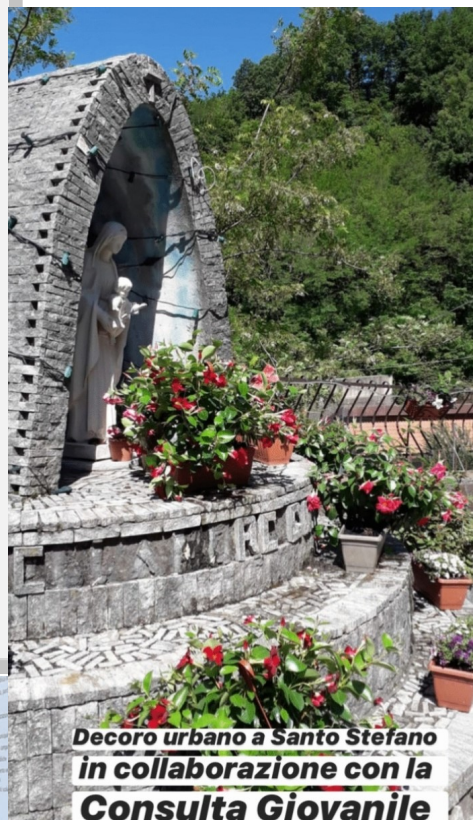
Decoro urbano a Santo Stefano in collaborazione con la Consulta Giovanile