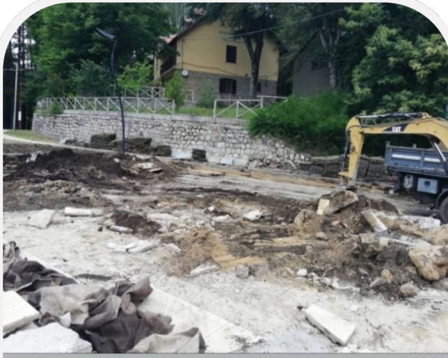
Lavori di Riapertura ai veicoli dell' attraversamento della Piazza Grande a Gambarie