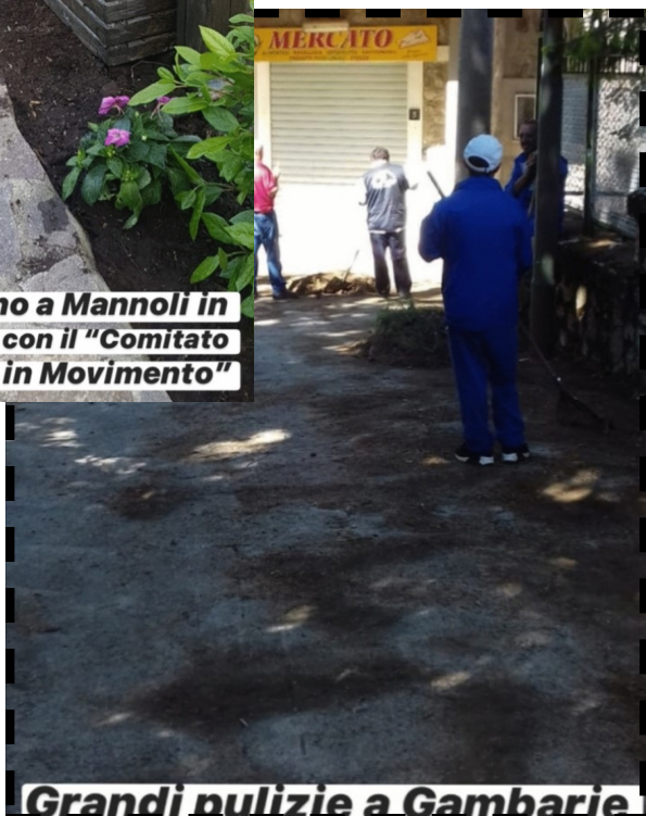
Grandi pulizie a Gambarie